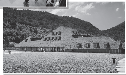
ラコリーナ 近江八幡