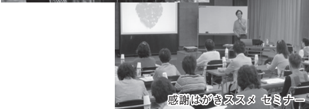
セミナー ススメがき感謝